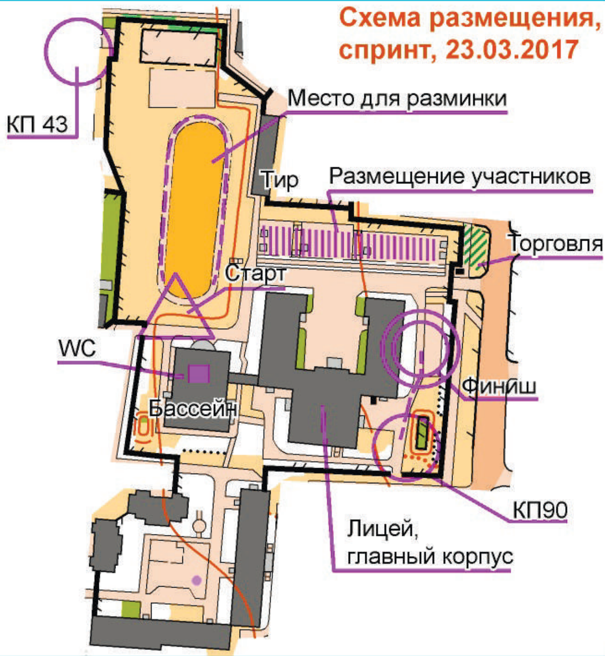
Схема размещения, спринт, 23.03.2017