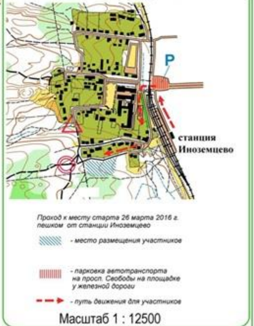
СХЕМА МЕСТ СТАРТА И ФИНИША (пос.Иноземцево, станция Машук)