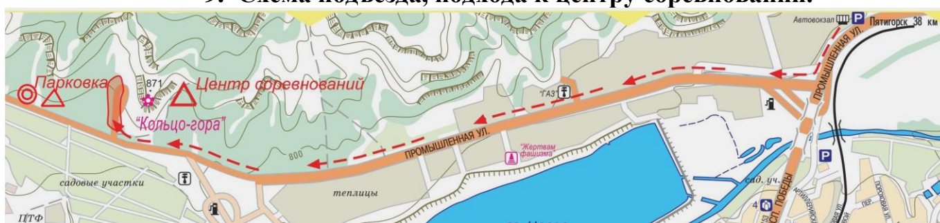
Схема стартов 30.03 и 31.03.2019.