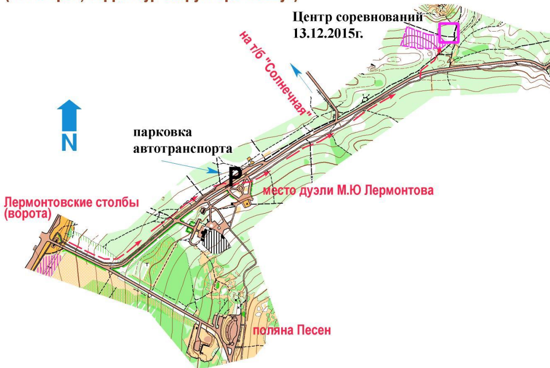
СХЕМА ПОДЪЕЗДА (Пятигорск, терренкур вокруг горы Машук)

Проход к месту проведения соревнований 13 декабря 2015г. только пешком по асфальтированному терренкуру вокруг горы Машук. Проезд любыми видами автотранспорта возможен только до стоянки у памятника у Места дуэли М.Ю Лермонтова.